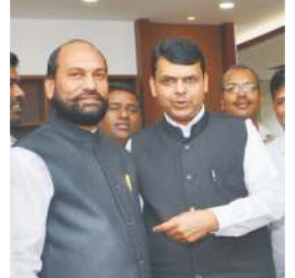
मा. श्री. देवेन्द्र फडणवीसजी मुख्यमंत्री, महाराष्ट्र राज्य