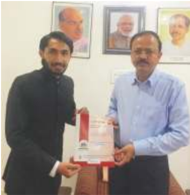
मा. श्री. सुभाष भामरेजी रक्षा राज्यमंत्री भारत सरकार