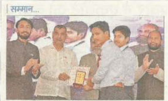
पुणे : नवें दिना डॉ. सुधाकरराव जाधव रोगशाला अँड एन्थुकेझनल ट्रस्ट की ओर से आयोजित तिसरी युवा संसदे के अंतर्गत कार्यक्रम में सहस्र संशोधन प्रतिष्ठान के निदेशकों का सम्मान किया गया।