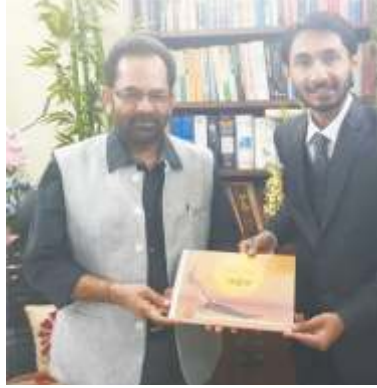
मा. श्री. मुख्तार अब्बास नकवीजी केन्द्रीय अल्पसंख्यांक मंत्री