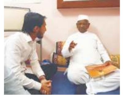
पदमभूषित मा. श्री. अण्णा हजारेजी