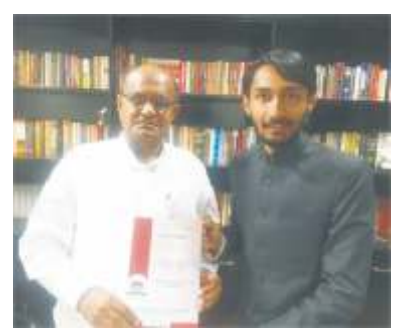
मा. श्री. के. सी त्यागीजी सांसद राज्यसभा अध्यक्ष - उद्योग संबंधी स्थाई समिती