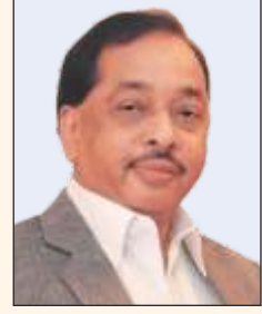
मा.श्री.नारायण राणे मा. मुख्यमंत्री, महाराष्ट्र राज्य