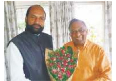
पद्मश्री एवं पद्मभूषण मा. श्री. विजय भटकरजी