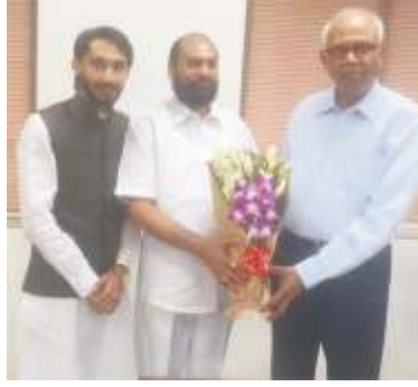
पद्म विभूषण मा. श्री. रघुनाथ माशेलकरजी