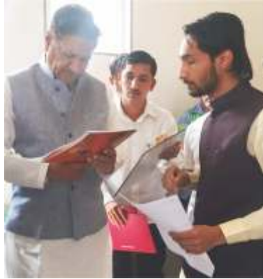
मा. श्री. पृथ्वीराज चव्हाणजी पूर्व मुख्यमंत्री, महाराष्ट्र राज्य