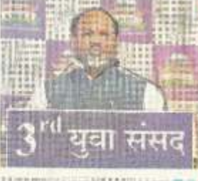
3 रा युवा संसद

राजकारणातून युवा पिढी दूर राहिले तर देशाचा विकास होऊ शकत नाही, असा सवाल उपस्थित करत खासदार डॉ. हीना गावीत यांनी युवा संसदेचे उद्घाटन करत आपले मत मांडले. युवा संसदेचे उद्घाटन करत खासदार डॉ. हीना गावीत यांनी युवा संसदेचे उद्घाटन करत आपले मत मांडले.