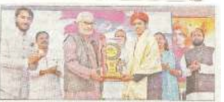
यावेळी युवा संसदेचे उद्घाटन करण्यात आले. डॉ. हिना गावित यांच्यासोबत असलेल्या व्यक्तींनीही प्रतीपादन करण्यात आले.