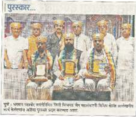
पुणे : प्रथम पारदर्शक समितीच्या विविध क्षेत्रांमधील विविध क्षेत्रांमधील सर्व क्षेत्रांमधील अहिंसा पुरस्कार प्रदान करण्यात आला.