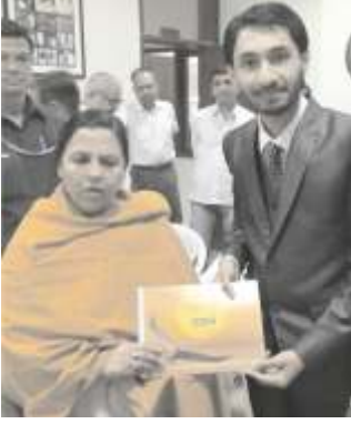
मा. सु.श्री. उमा भारतीजी केन्द्रीय जल संसाधन, नदी विकास और गंगा सफाई मंत्री