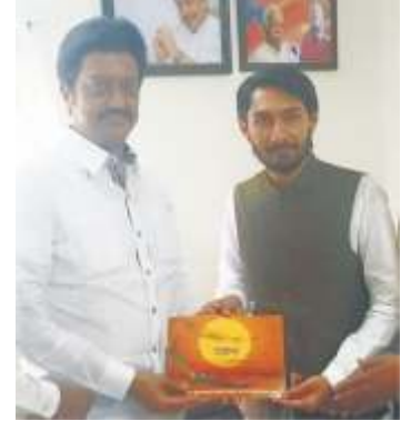
मा. श्री. अनिल शिरोळेजी सांसद, लोकसभा