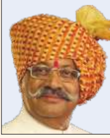
मा.महामहीम श्री.श्रीनिवास पाटील मा. राज्यपाल-सिक्कीम राज्य