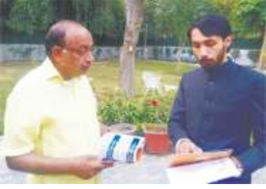
मा. श्री. विजय गोयलजी खेलमंत्री, भारत सरकार