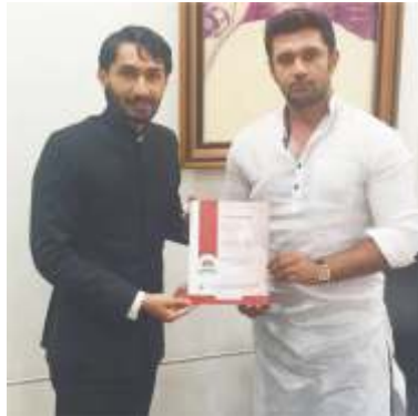
मा. श्री. चिराग पासवानजी सांसद (लोकसभा)