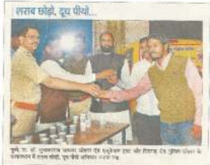
पुणे, दि. ३ जानेवारी २०१८ : नव्या वर्षाचे स्वागत करताना विद्यार्थ्यांच्या राण्यावर विरसणारी आणि मद्यधुंध झालेले तरुण-तरुणी दिसतात. परंतु व्यसनवादींमधील विडळपणात अडकत घालेल्या तरुणाईला गिरींगी अतोप्याध नाव द्यावेचिण्याकरिता महामंडळातील तरुणाई आणि पोलिसांनी पुढाकार घेतला. 'दारू सोडा, दूध प्या' असा संदेश देत तरुणाईसोबत पोलिसांनी देखील दूधपाटम केले.