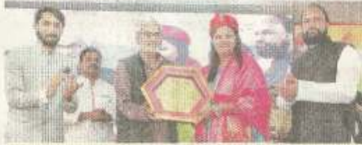
पुणे ४ फेब्रुवारी रोजी युवा संसदेचे उद्घाटन करण्यात आले. खासदार डॉ. हीना गावीत यांनी युवा संसदेचे उद्घाटन करत आपले मत मांडले.

राजकारणातून युवा पिढी दूर राहिले तर देशाचा विकास होऊ शकत नाही, असा सवाल उपस्थित करत खासदार डॉ. हीना गावीत यांनी युवा संसदेचे उद्घाटन करत आपले मत मांडले. युवा संसदेचे उद्घाटन करत खासदार डॉ. हीना गावीत यांनी युवा संसदेचे उद्घाटन करत आपले मत मांडले. युवा संसदेचे उद्घाटन करत खासदार डॉ. हीना गावीत यांनी युवा संसदेचे उद्घाटन करत आपले मत मांडले.