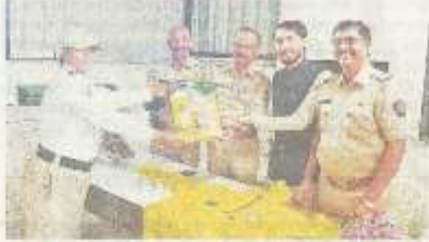
जाधवर ग्रुप ऑफ इन्स्टिट्यूटतर्फे पोलिसांना रेनकोट देण्यात आले.