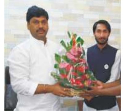
मा. श्री. धनंजय मुंडेजी विरोधी पक्ष नेता (विधान परिषद), महाराष्ट्र राज्य