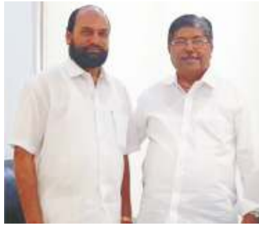
मा. श्री. चंद्रकांत बच्चू पाटीलजी महसूल, मदत व पुनर्वसन, सार्वजनिक बांधकाम मंत्री, महाराष्ट्र राज्य