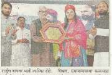
खासदार डॉ. हीना गावीत यांनी युवा संसदेचे उद्घाटन करत आपले मत मांडले.

राजकारणातून युवा पिढी दूर राहिले तर देशाचा विकास होऊ शकत नाही, असा सवाल उपस्थित करत खासदार डॉ. हीना गावीत यांनी युवा संसदेचे उद्घाटन करत आपले मत मांडले.