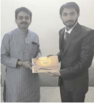
मा. श्री. राजीव सातवजी सांसद एवं राष्ट्रीय युवा कांग्रेस के भूतपूर्व अध्यक्ष